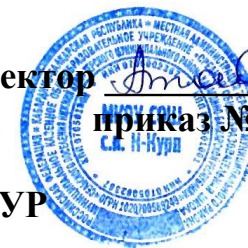
ГРАФИК ПРОВЕДЕНИЯ ОЦЕНОЧНЫХ ПРОЦЕДУР на I полугодие 2022/2023 учебного года в МКОУ с.п. Нижний Курп НАЧАЛЬНОЕ ОБЩЕЕ ОБРАЗОВАНИЕ: